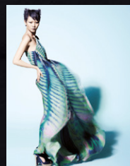
Plan en pied (refusé)