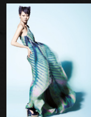
Plan en pied (refusé)